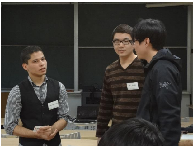
ディスカッションの様子