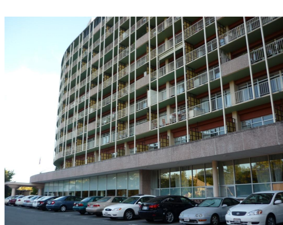
宿泊:Channing House (自立型高齢者住宅)

シリコンバレーの北部に位置する都市。ヒューレット・パカードやフェイスブックの本社などの複数のハイテク企業の本拠地として知られる。