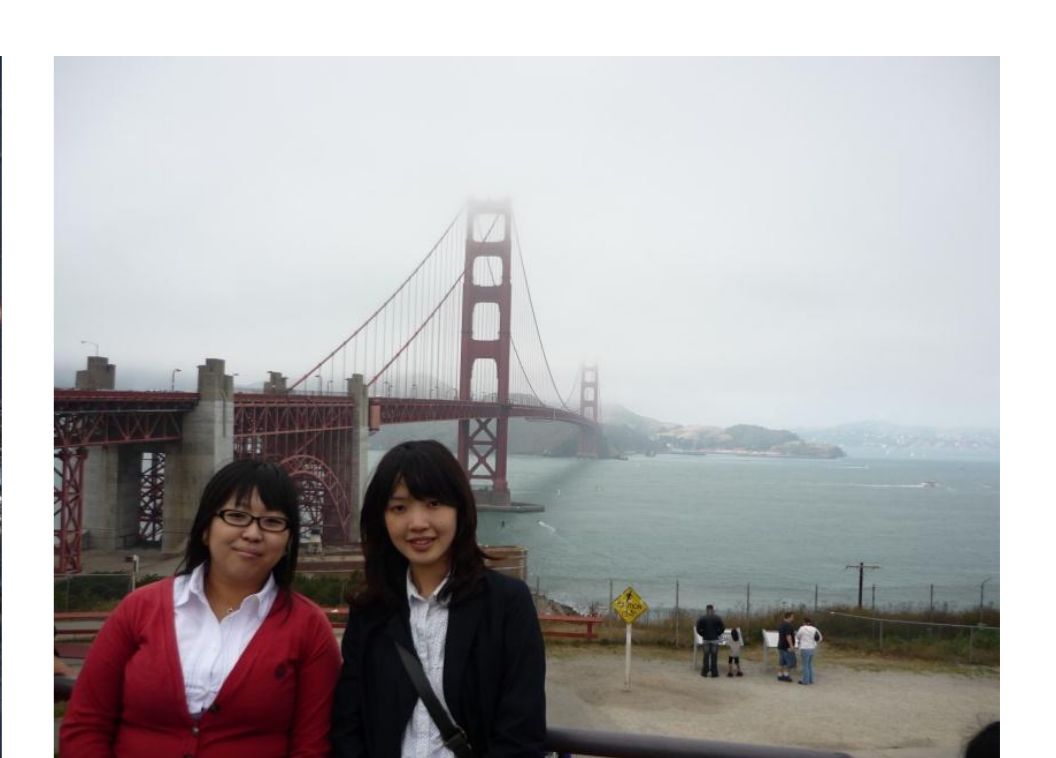
サンフランシスコ観光名所Golden Gate Bridgeにて