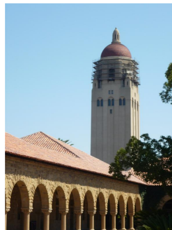
Palo Alto 市はStanford大学の敷地に隣接している