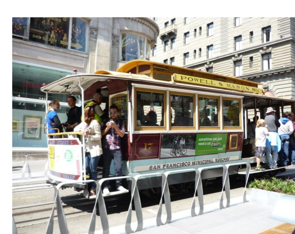
サンフランシスコ名物のケーブルカーに乗車